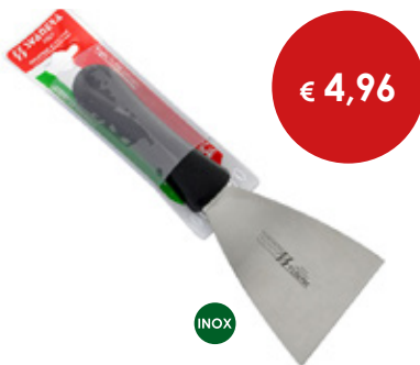
Spatola Pizza Triangolare