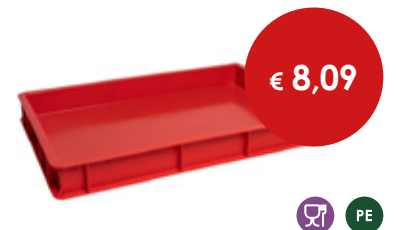
Cassetta pizza rossa