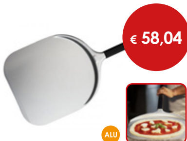
Pala per pizza rettangolare

Cod. Testa Manico Totale 0614851 Ø cm 20 L. cm 150 L. cm 171