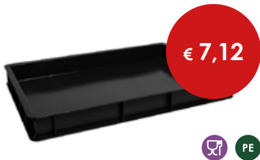
Cassetta pizza nera