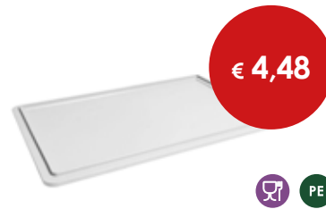
Coperchio cassette pizza