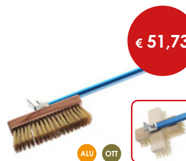
Spazzola orientabile con setole ottone

Cod. Spazzola Totale 0614891 cm 20 x 6 x h 11 L. cm 201