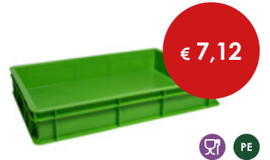
Cassetta pizza verde