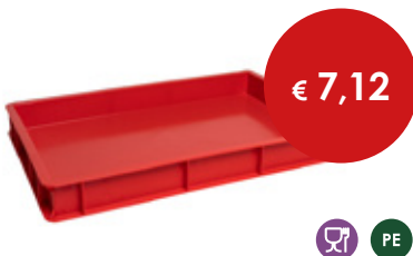
Cassetta pizza rossa