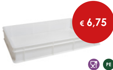
Cassetta pizza bianche