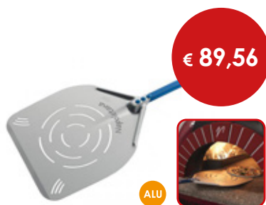
Pala per pizza rettangolare forata

Cod. Testa Manico Totale 0614947 cm 33 x 33 L. cm 150 L. cm 186