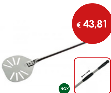
Palettino per pizza forato rinforzato

Cod. Testa Manico Totale 0614870 Ø cm 20 L. cm 150 L. cm 171