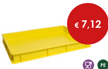
Cassetta pizza giallo