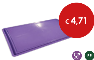
Coperchio cassette pizza