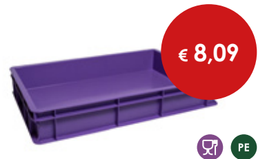
Cassetta pizza viola HACCP