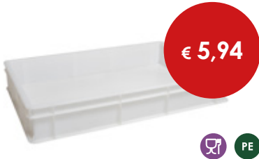
Cassetta pizza bianche