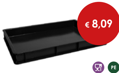
Cassetta pizza nera