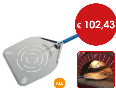
Pala per pizza rettangolare forata

Cod. Testa Manico Totale 0614947 cm 33 x 33 L. cm 150 L. cm 186