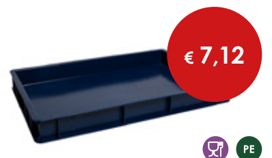
Cassetta pizza blu