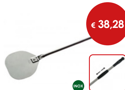
Palettino per pizza rinforzato

Cod. Testa Manico Totale 0614913 cm 36 x 36 L. cm 150 L. cm 196