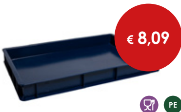
Cassetta pizza blu