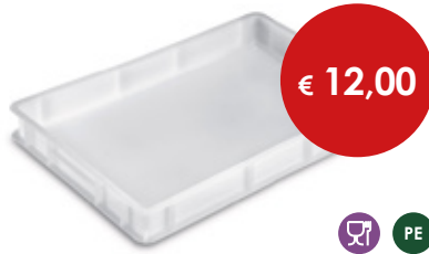
Cassetta Service piena sovrapponibile