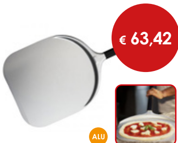
Pala per pizza rettangolare

Cod. Testa Manico Totale 0614912 cm 33 x 33 L. cm 150 L. cm 192