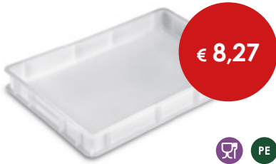
Cassetta Service piena sovrapponibile