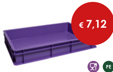
Cassetta pizza viola HACCP