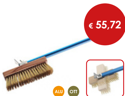
Spazzola orientabile con setole ottone

Cod. Testa Manico Totale 0614871 Ø cm 20 L. cm 150 L. cm 171