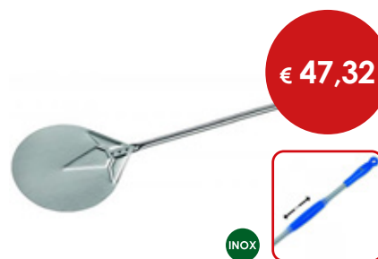
Palettino per pizza

Cod. Testa Manico Totale 0614949 cm 36 x 36 L. cm 150 L. cm 190