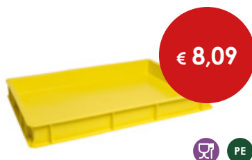
Cassetta pizza giallo