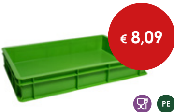
Cassetta pizza verde